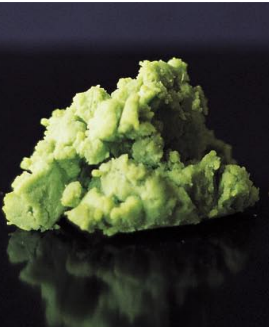
Wasabi, preparato in forma di pasta, tipica della cucina giapponese

Nella medicina popolare il rafano bianco per uso esterno viene utilizzato come revulsivo nei dolori reumatici e nelle