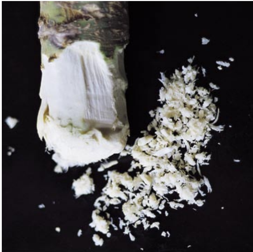
La preparazione del cren inizia grattugiando la radice, che sprigiona le sostanze volatili